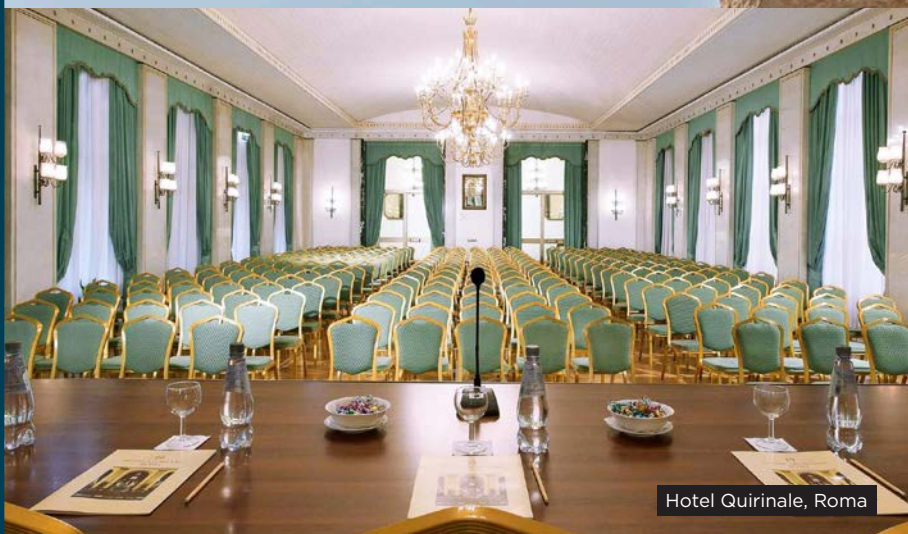
Hotel Quirinale, Roma

🔗 RELAZIONI , per sviluppare modelli innovativi di leadership diffusa ispirati alla reciprocità.