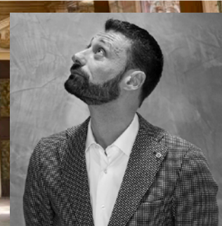
Ivan Foina Innovatiere Sherpa B-muse