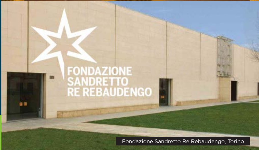
Fondazione Sandretto Re Rebaudengo, Torino